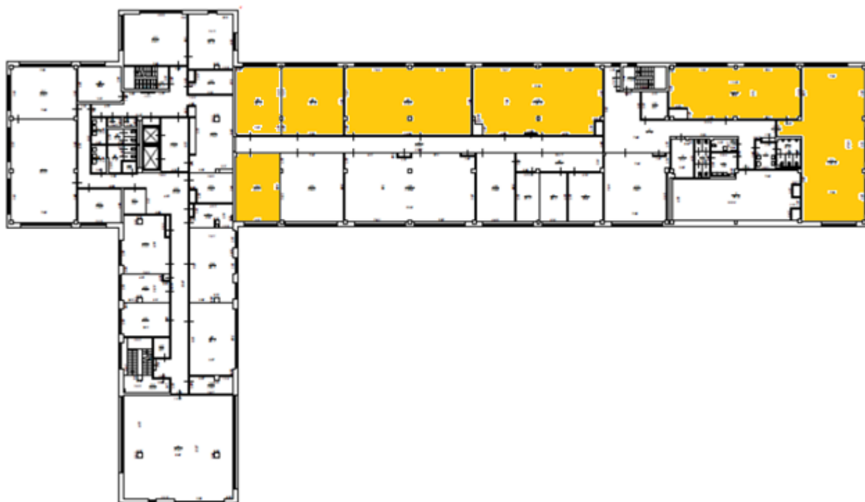
Схема Помещения, четвертый этаж Здания (арендуемые помещения выделены цветом)