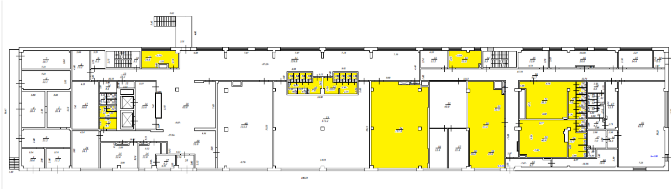
Схема Помещения, второй этаж Здания (арендуемые помещения выделены цветом)

Схема Помещения, первый этаж Здания (арендуемые помещения выделены цветом)